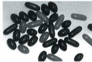
コエンザイムQ10はサプリメントとしての活用が期待されている栄養補助食品

では、サプリメントや美容クリームなどに活用され、サプリメントは常に売上げベスト3にランクされるほどという。日本国内では医療機関において薬用としての活用のみであったが、01年3月から素材としての使用が許可されている。コエンザイムQ10を世界に供給できるのは日本の企業だけ。今後の展開に注目が寄せられる。 TEL 03・32230・4433